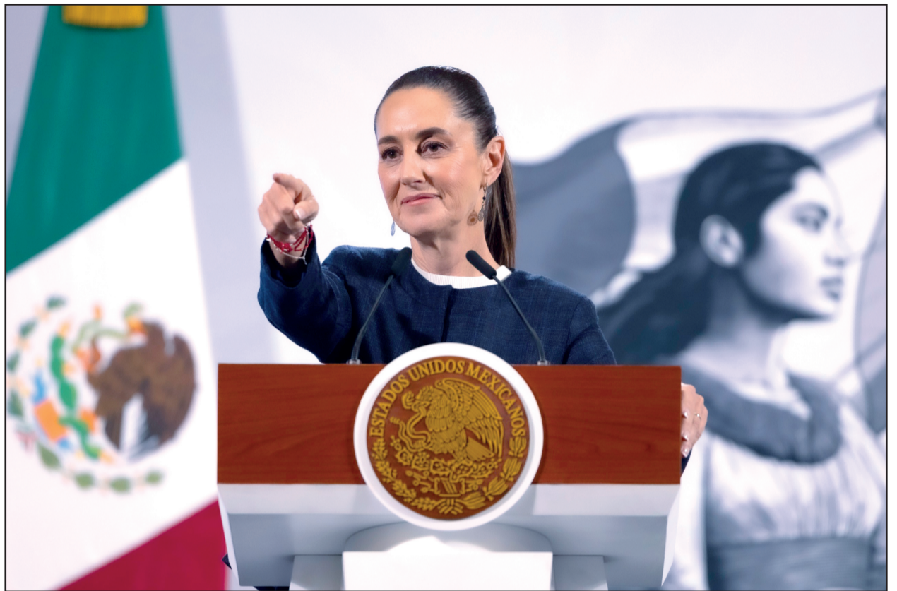
Presidenta Claudia Sheinbaum Pardo.