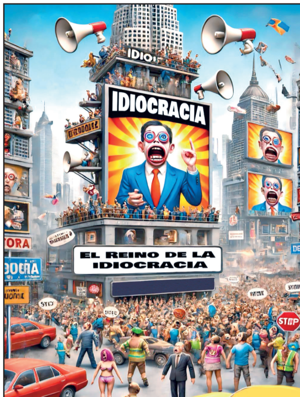
Portada del libro Ideocracia ...

En consecuencia, a la primera mujer presidenta se le impuso, mediante un “acuerdo” previo, quién iba a coordinar el Senado, quién la Cámara de Diputados (con la capacidad de rechazar la iniciativa presidencial sobre el nepotismo), y también, aunque no se dijo, al poder real en el partido, un legado de apellido López. Tal “acuerdo”, verdadera amenaza condicionante, de que, si