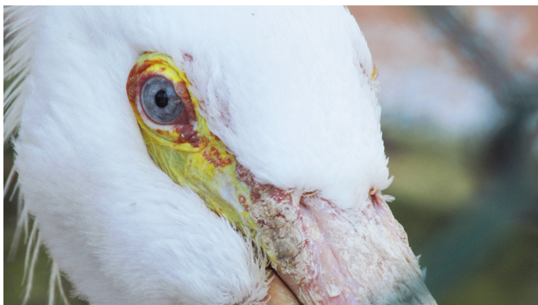
Titulo: ¿Qué me ves?