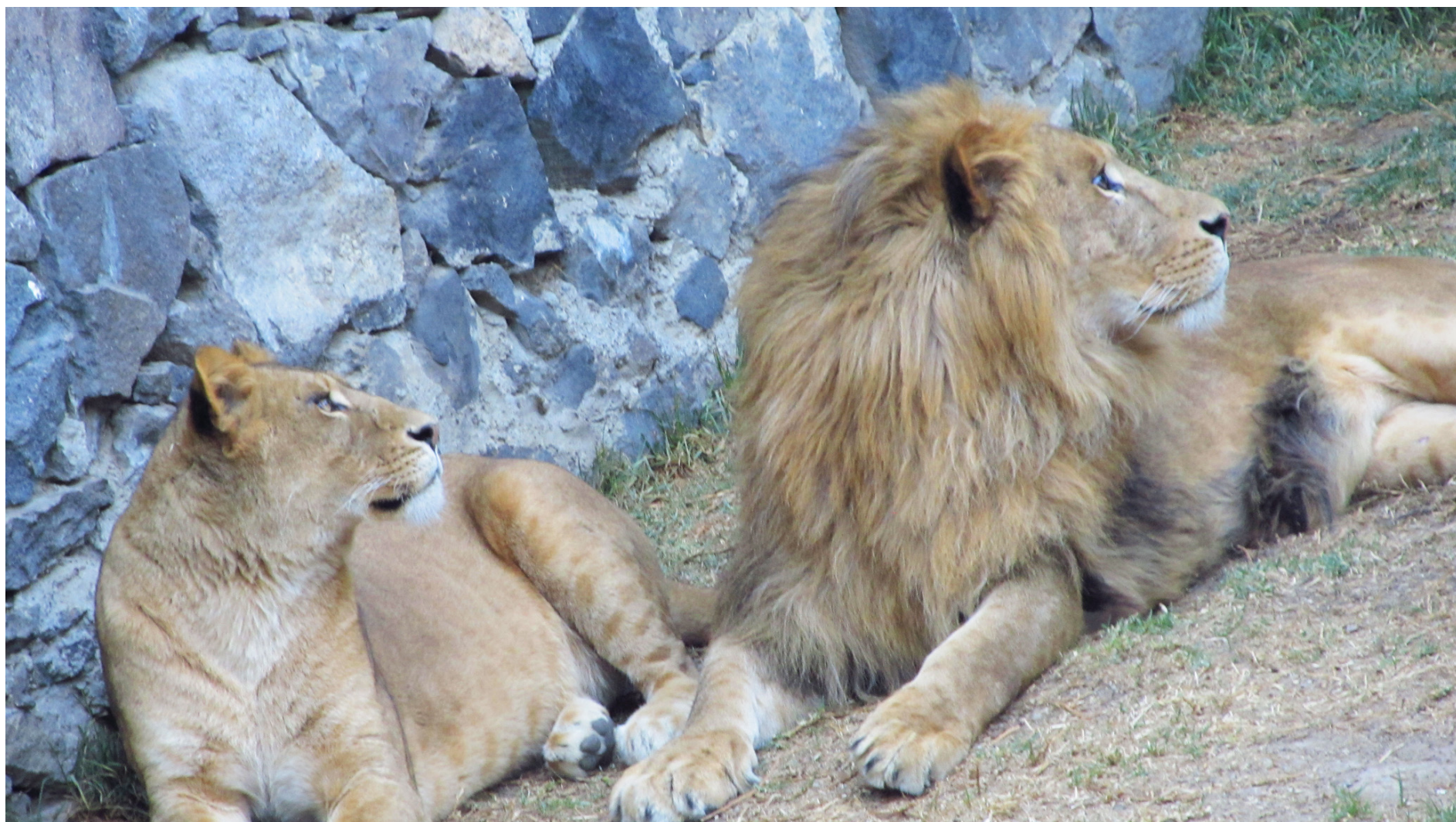
Titulo: Saboreando al hombre