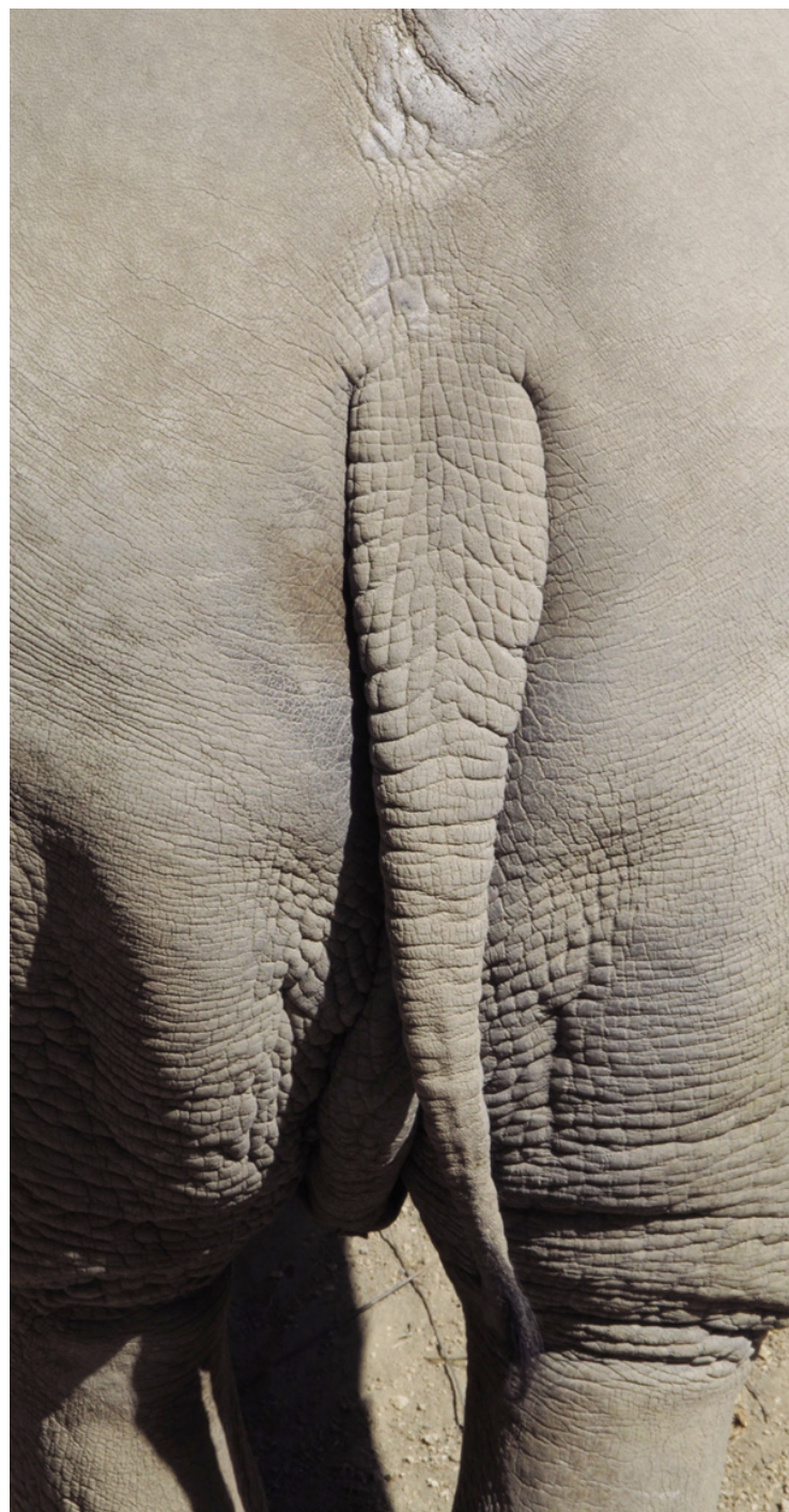
Titulo: No es lo mismo cola que culo