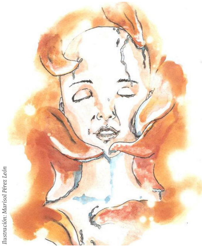
Ilustración: Marisol Pérez León

Con siete números a cuestas en esta, lo que podría llamarse, su segunda época del suplemento juvenil de nuestro semanario Unión y a un año de vida editorial; quienes participamos en su elaboración queremos compartir con ustedes, nuestros lectores, el enorme gusto de esta ardua tarea que mes tras mes hemos decidido asumir. Sobre todo queremos insistir en que este esfuerzo periodístico ha estado siempre y así seguirá, abierto a cualquiera que le interese escribir una reseña musical, crónica, cuento, poesía, ensayo histórico o reflexión política, o incluso quiera mandar una fotografía, un cartón o hasta un saludo.