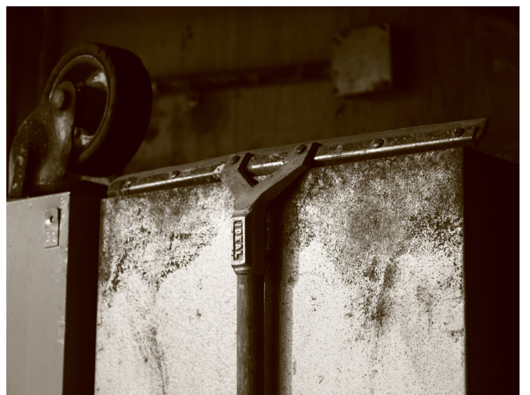
Sin título / Erik Rojas Méndez