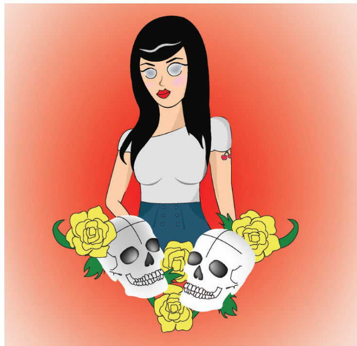
Ilustración: Diana Rojas García