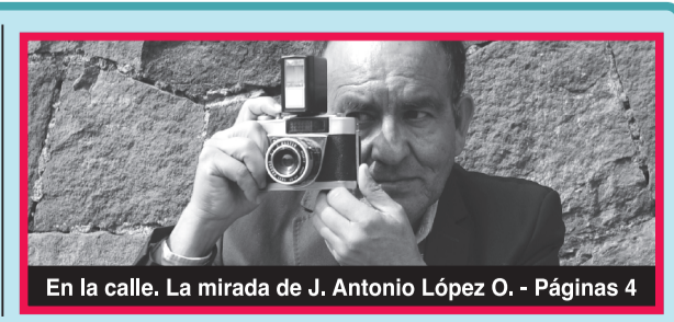
En la calle. La mirada de J. Antonio López O. - Páginas 4