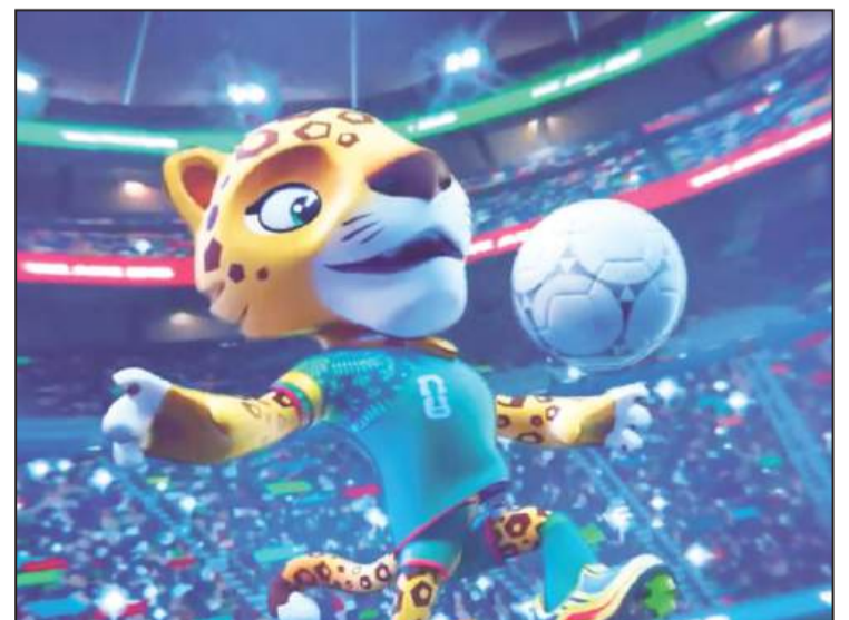
Jaguar Zayu.

Por todos estos argumentos es que, para seguir concientizando a la gente para el cuidado y protección de los jaguares, sirve de mucho que la mascota de México para esta 23.ª Copa Mundial de Fútbol sea nuestro mítico felino. 🐆