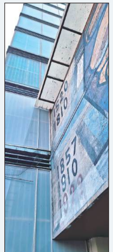
Rectoría UNAM 2026

La vinculación de la salud institucional con la salud individual y laboral, requiere formar parte como tema esencial de la reforma universitaria, coincidir el nivel institucional con los