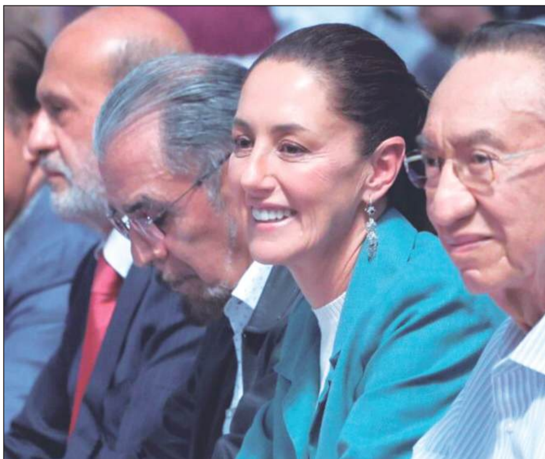
Imagen de archivo, noviembre 6 de 2023

Confederación de Trabajadores y Trabajadoras de las Universidades de las Américas