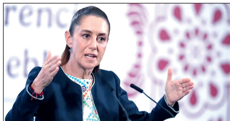
Protesta en Los Ángeles.

Desde que esto fue anunciado, la derecha mexicana y sus ya muy gastados intelectuales, pusieron el grito en el cielo y calificaron el hecho como una acción más propia de una dictadura; o sea que solo ellos, como dictadores que fueron durante décadas, si podían proponer reformas electorales, varias de las cuales nos llevaron a sufrir desde fraudes electorales a elecciones a modo, como la de 1988 en favor de Carlos Salinas de Gortari o la del 2006 con Felipe Calderón. Ahora, desde posiciones de alta legitimidad popular, como la que tiene actualmente Claudia Sheinbaum Pardo, que ya rebasa el 75 % de apoyo, se le califica a la pretensión de llevar adelante esa reforma, como una muestra dicta-