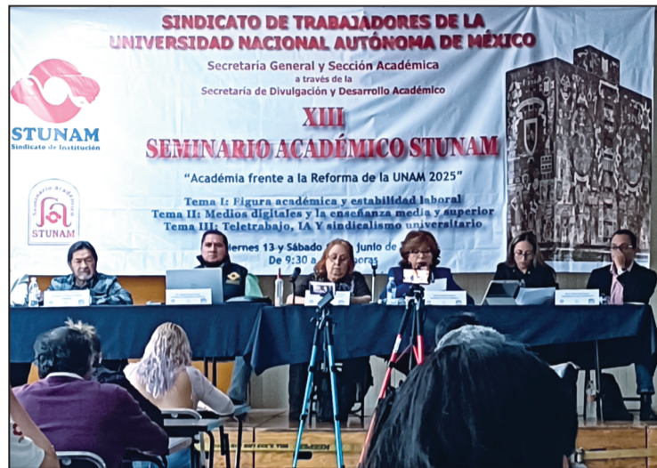
XIII Seminario Académico.