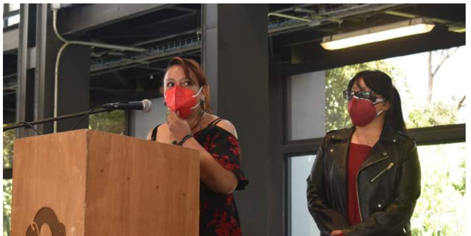
Compañeras del Instituto de Investigaciones Antropológicas

Por último, en el tema del Centro de Educación Preescolar y Primaria del STUNAM - CEPSTUNAM- comentó a los trabajadores que el regreso a clases presenciales será voluntario y se