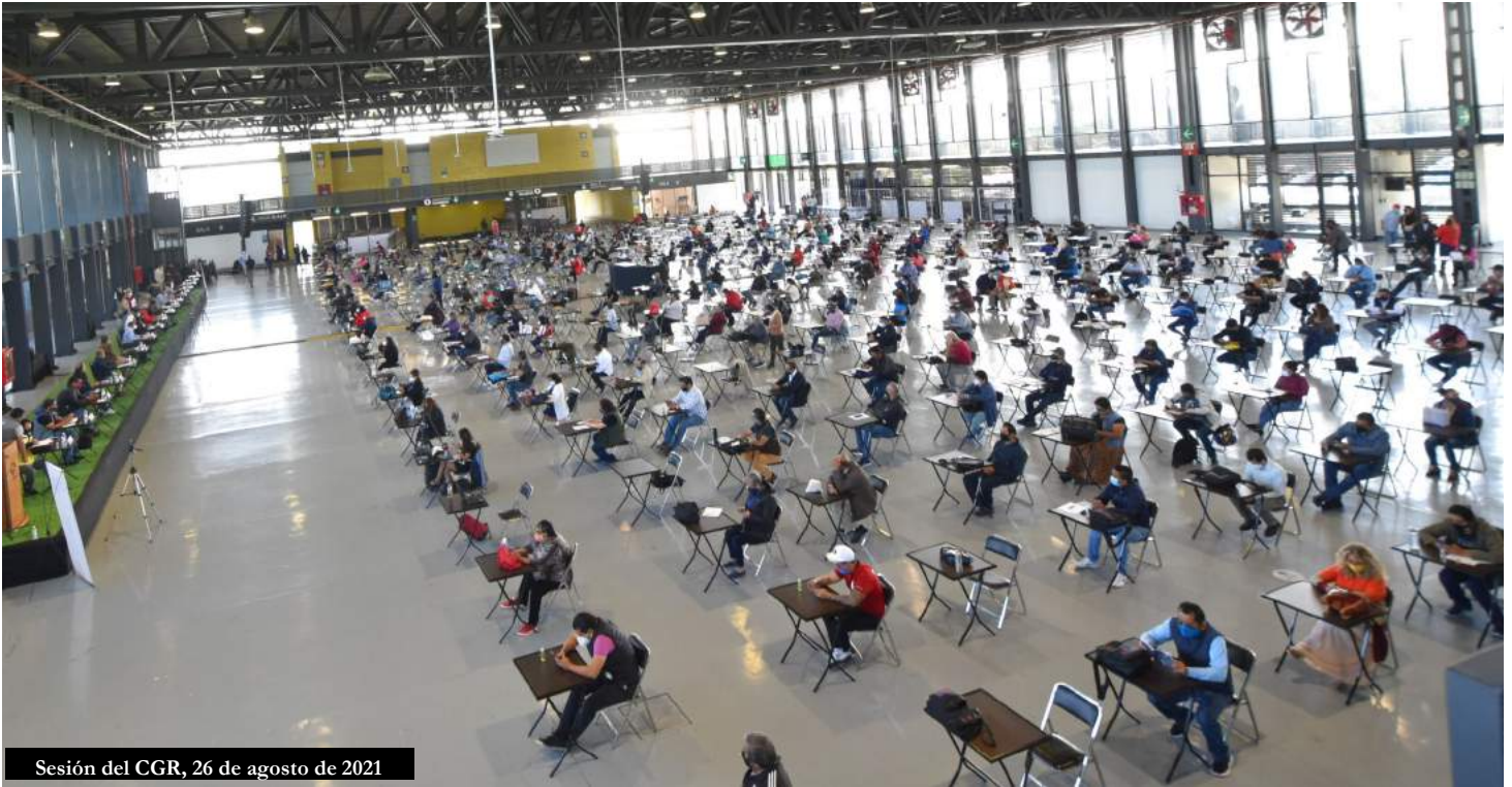
Sesión del CGR, 26 de agosto de 2021

En medio de cuidadosos protocolos sanitarios y atendiendo las medidas establecidas para evitar la propagación del COVID 19, los miembros del Comité Ejecutivo, delegados sindicales y equipos de trabajo del STUNAM se dieron cita el pasado 26 de agosto, en el Centro de Exposiciones y Convenciones de la UNAM para sesionar de manera extraordinaria.