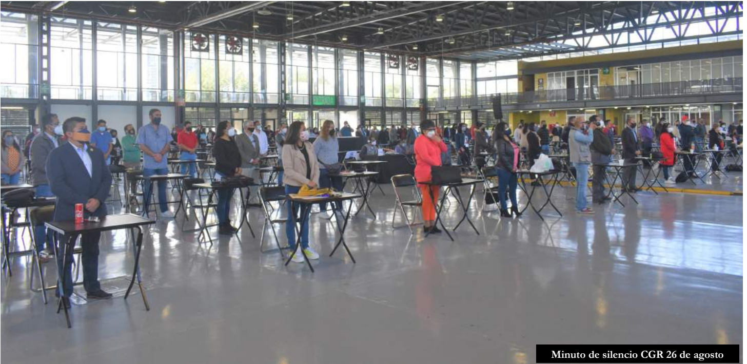
Mínuto de silencio CGR 26 de agosto

diente al 2020 la cual es realizada por el Instituto Nacional de Transparencia Acceso a la Información y Protección de Datos Personales. El abogado dio lectura al documento para hacerlo de conocimiento al Consejo General de Representantes. Abundó comentando que esta verificación se hace todos los años, desde 2015 y en el cual el STUNAM es un sujeto obligado a transparentar todo lo que tiene que ver con el uso y gestión de recursos públicos, dijo que estas verificaciones realizadas año con año han sido obtenidas de manera satisfactoria con el cien por ciento y es un orgullo que nuestro sindicato tenga estas calificaciones cuando muchos de ellos no las obtienen. Reconoció que este resultado es producto de todo el trabajo de la organización sindical.