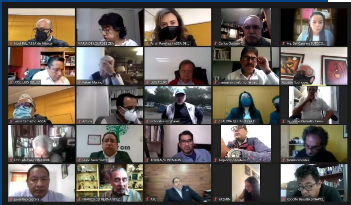
Pleno de la UNT, de septiembre de 2021