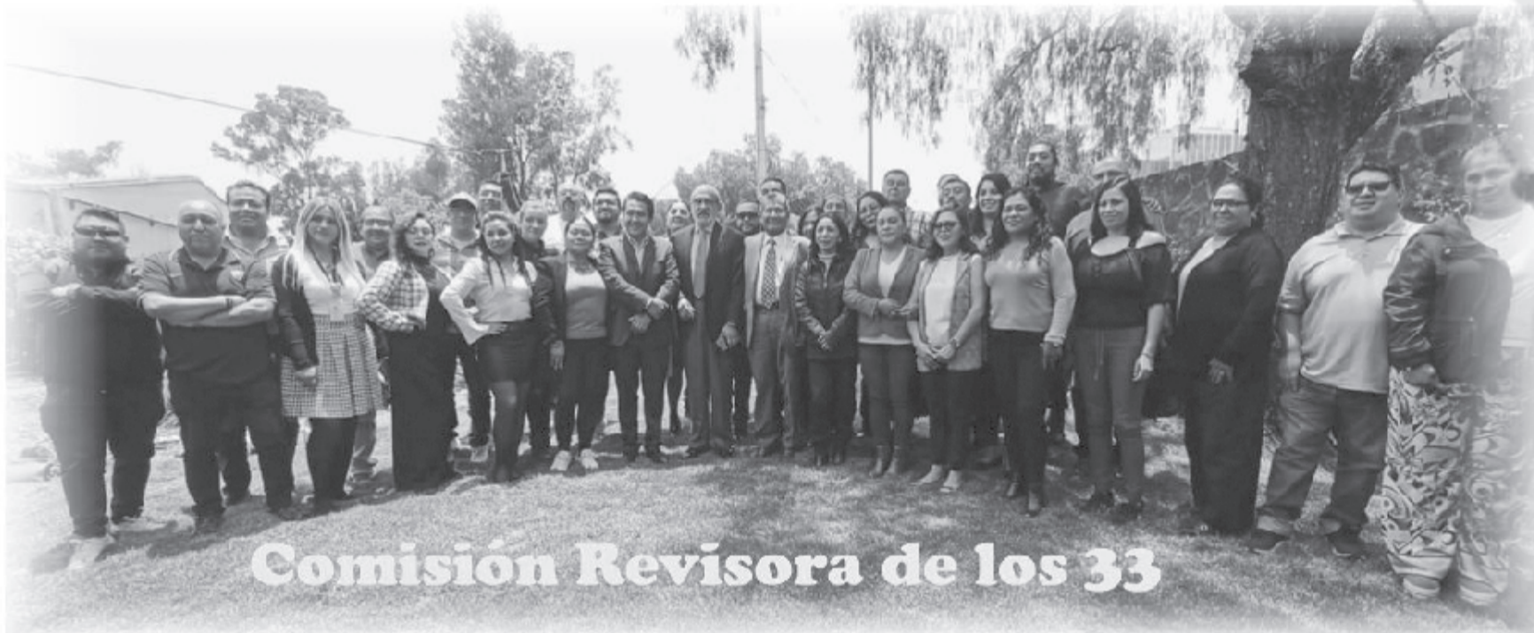
Comisión Revisora de los 33