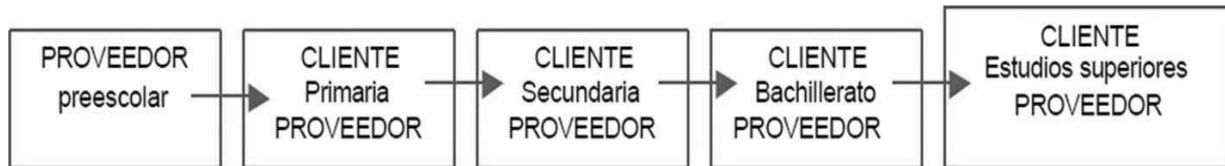
Diagrama 1: Diagrama de flujo de los enlaces de la educación, desde el nivel básico hasta el superior.

Las modificaciones al artículo tercero constitucional, están precedidas por algunas recomendaciones de la Organización para la Cooperación y el Desarrollo Económicos, realizadas en el año 2010 en el Acuerdo de cooperación México-OCDE para mejorar la calidad de la educación de las escuelas mexicanas. En el apartado: Hacia una reforma educativa en México, aseguran que la mejora en la calidad educativa es una prioridad política y social en México, especialmente en años recientes, debido a las altas tasas de pobreza, la fuerte desigualdad y el aumento de la criminalidad. Aunque ha habido una mejora educativa y un enfoque cada vez más importante en las políticas educativas en años recientes, todavía una alta proporción de jóvenes no finalizan la educación media superior y el desempeño de los estudiantes no es suficiente para proporcionar las habilidades que México necesita.