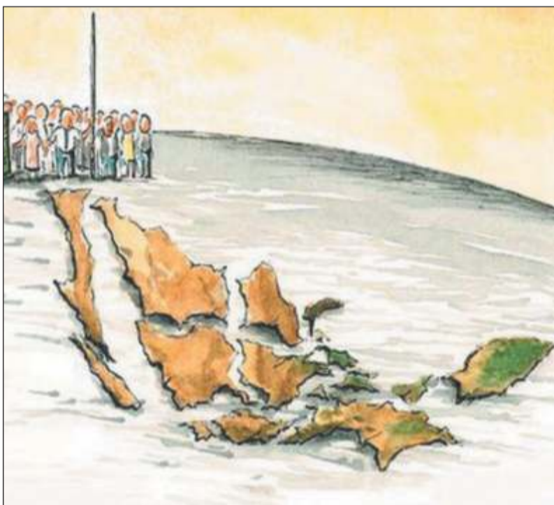
Imagen: http://www.milenio.com/ Autor: Victor Solís

Los ejemplos de esta desigualdad podríamos seguirlos enlistando y se han profundizado aun más debido en buena parte a las reformas estructurales que se nos han impuesto y que solamente han generado zozobra y malestar social; éstas, por sólo señalar un aspecto, han golpeado severamente a la educación pública y de manera particular a la superior, la que se encuentra muy maltratada debido al descuido al que ha sido sometida por parte del gobierno y legisladores, fundamentalmente por el recorte y drásticas disminuciones de recursos económicos.